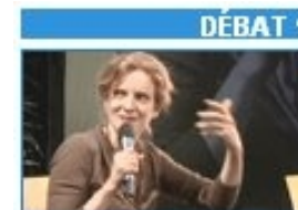
Débat citoyen avec la Secrétaire d'Etat à l'Écologie - PARTIE 1

Durée totale de la 1 ère partie : 21':10"